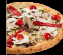
BOVINA TOMATE 15,90 €

Crème fraîche légère, mozzarella, bœuf haché, oignons grillés, poivrons, champignons frais, tomates cerises, pesto au basilic frais