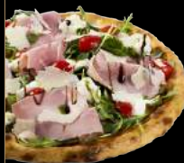
ROQUETTE ROYALE 15,90 €

Sauce tomate, mozzarella, champignons frais, jambon de Parme, roquette fraîche, mozzarella du bufala, pesto au basilic frais et filet de balsamique