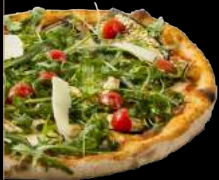
PARMIGIANA 13,90 €

Sauce tomate, mozzarella, aubergines grillées, roquette fraîche, tomates cerises, pesto au basilic frais et filet de balsamique