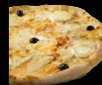
5 FROMAGES 15,90 €

Sauce tomate, mozzarella, champignons frais, poivrons grillés, oignons grillés, courgettes grillées, aubergines grillées, olives