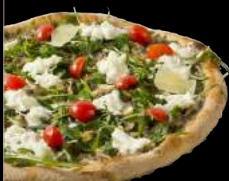
TRUFFE 16,90 €

Crème fraîche légère, mozzarella, tranches de saumon, roquette fraîche, tomates cerises et filet de balsamique