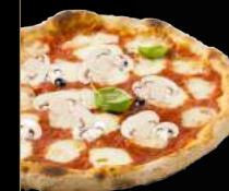
MARGHERITA CHAMPI 10,90 €

Sauce tomate, mozzarella, champignons frais, olives