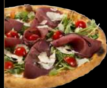
BRESAOLA 15,90 €

Crème d'artichaut, mozzarella, roquette fraîche, artichauts, champignons frais, copeaux de parmesan, pesto au basilic frais et filet de balsamique