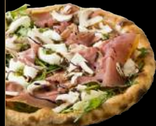
PARMA 14,90 €

Crème truffée, champignons frais, roquette fraîche, mozzarella di bufala, copeaux de parmesan, tomates cerises, pesto au basilic frais et filet de balsamique