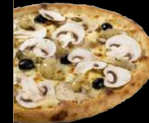
BLANCHE (POULET) 14,90 €

Sauce tomate, mozzarella, tomates cerises, mozzarella di bufala, pesto, feuilles de basilic