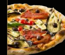
VEGGIE 13,90 €

Sauce tomate, mozzarella, champignons frais, jambon, artichauts, olives