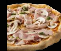
REINE 12,90 €

Sauce tomate, mozzarella, champignons frais, olives