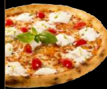
MARGHA MOZZ ART 11,90 €

Sauce tomate, mozzarella, tomates cerises, mozzarella di bufala, pesto, feuilles de basilic