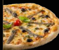
NAPOLITAINE 12,90 €

Sauce tomate, mozzarella, champignons frais, jambon, pesto au basilic frais