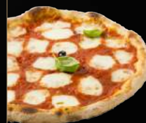
MARGHERITA 9,00 €