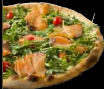
SAUMON 15,90 €

Crème fraîche légère, mozzarella, fromage de chèvre, miel, roquette fraîche, tomates cerises et filet de balsamique