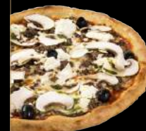
BOVINA CRÈME 15,90 €

Sauce tomate, mozzarella, thon, chèvre, oignons, olives, champignons frais, persillade