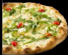
CHÈVRE 14,90 €

Sauce tomate, mozzarella, aubergines grillées, roquette fraîche, tomates cerises, pesto au basilic frais et filet de balsamique