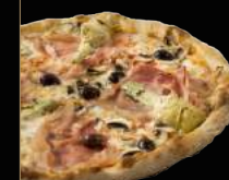
4 SAISONS 13,90 €

Sauce tomate, mozzarella, anchois, câpres