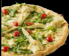
ARTICHAUT 16,90 €

Sauce tomate, mozzarella, roquette fraîche, mozzarella di bufala, jambon, tomates cerises, copeaux de parmesan, pesto au basilic frais et filet de balsamique