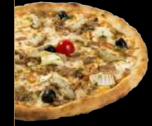
CHÈVRETTE 14,90 €

Crème fraîche légère, mozzarella, poulet, oignons grillés, olives, champignons frais